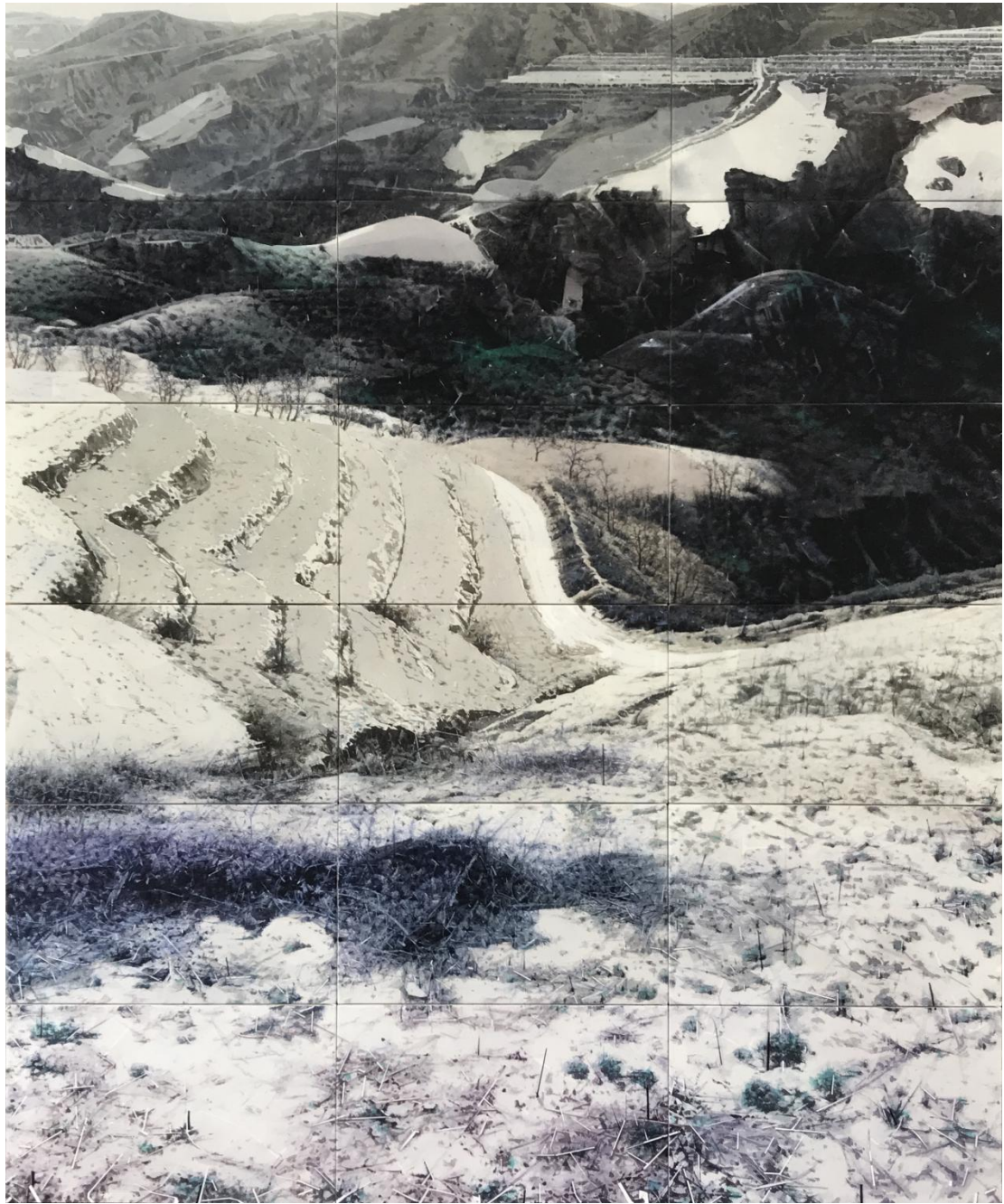
《山河故墟》 2019 150x180cm 30X50CMX18 材质：纸上水彩