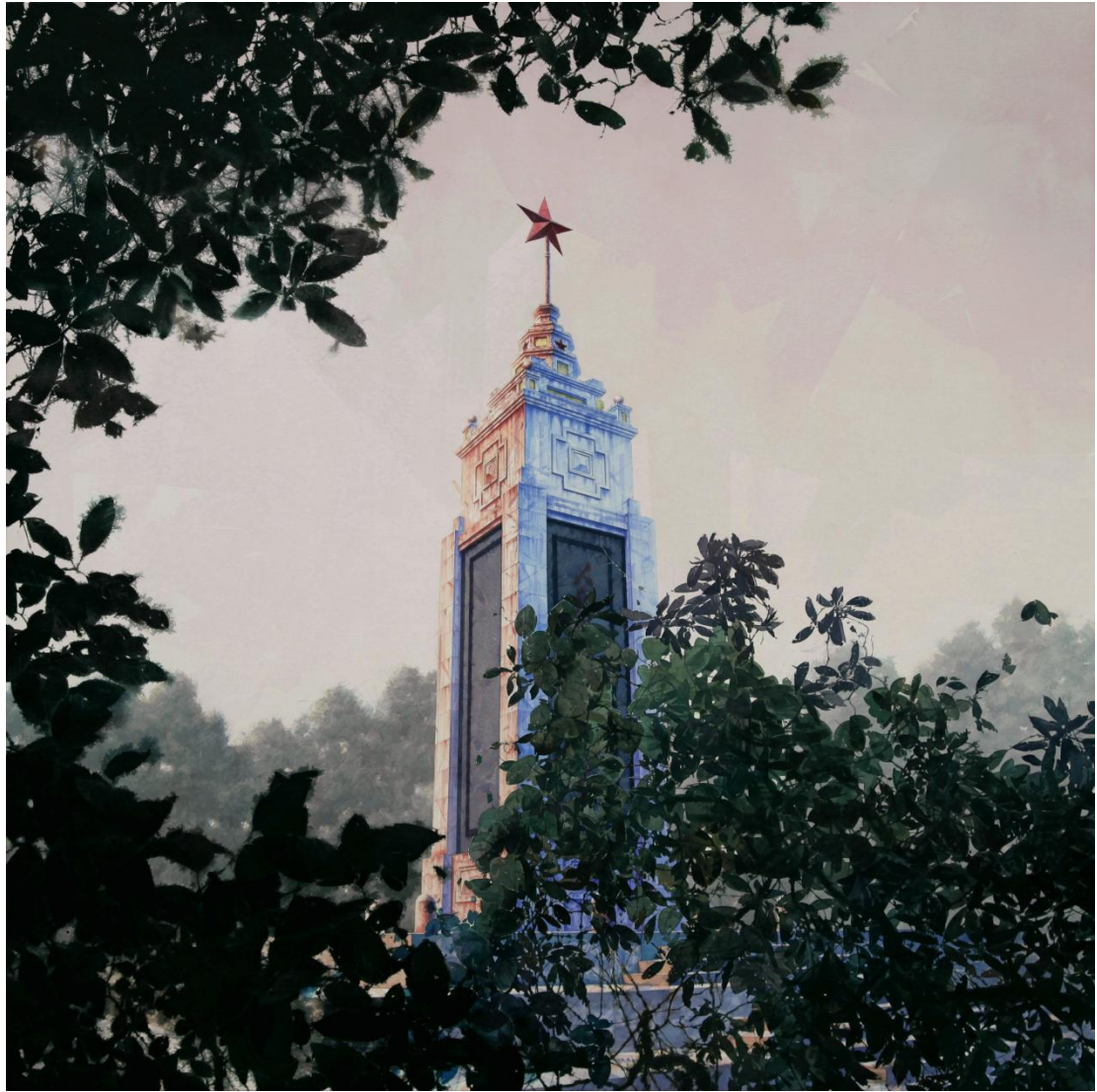
《英雄》 2015 150×150cm 材质：纸上水彩