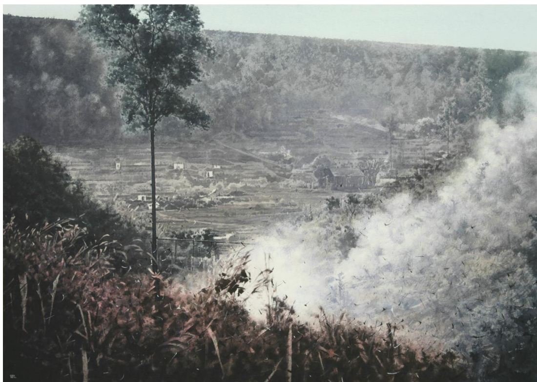
《边地》 2016 112×80cm 材质：纸上水彩