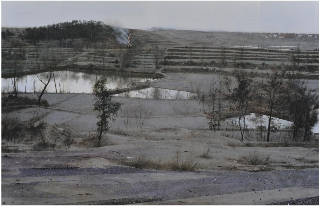
《山火》 2011 152×100cm 材质：纸上水彩