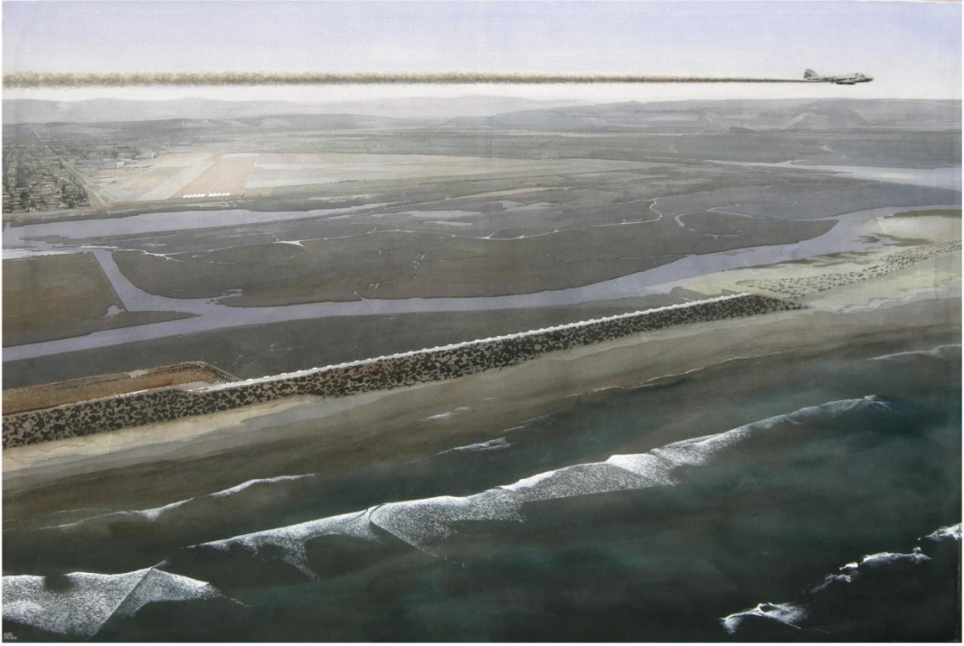
《巡航》 2008 170×112cm 材质：纸上水彩