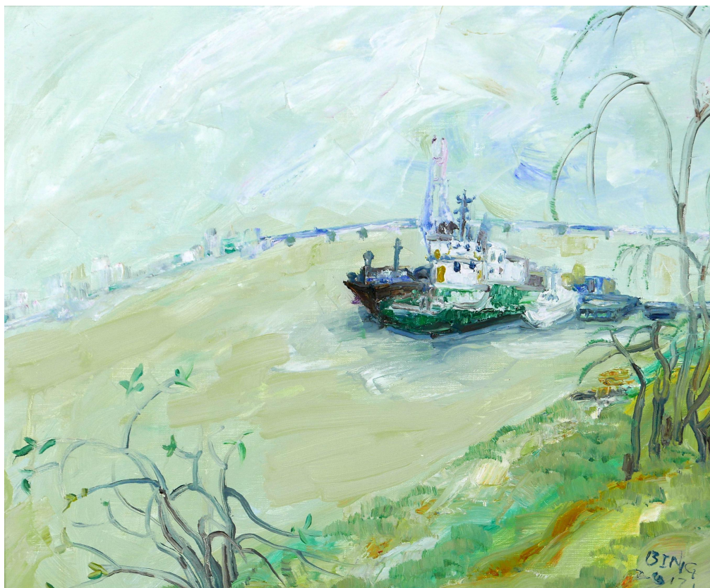
白风景系列之武昌江滩的船 4 50×60cm