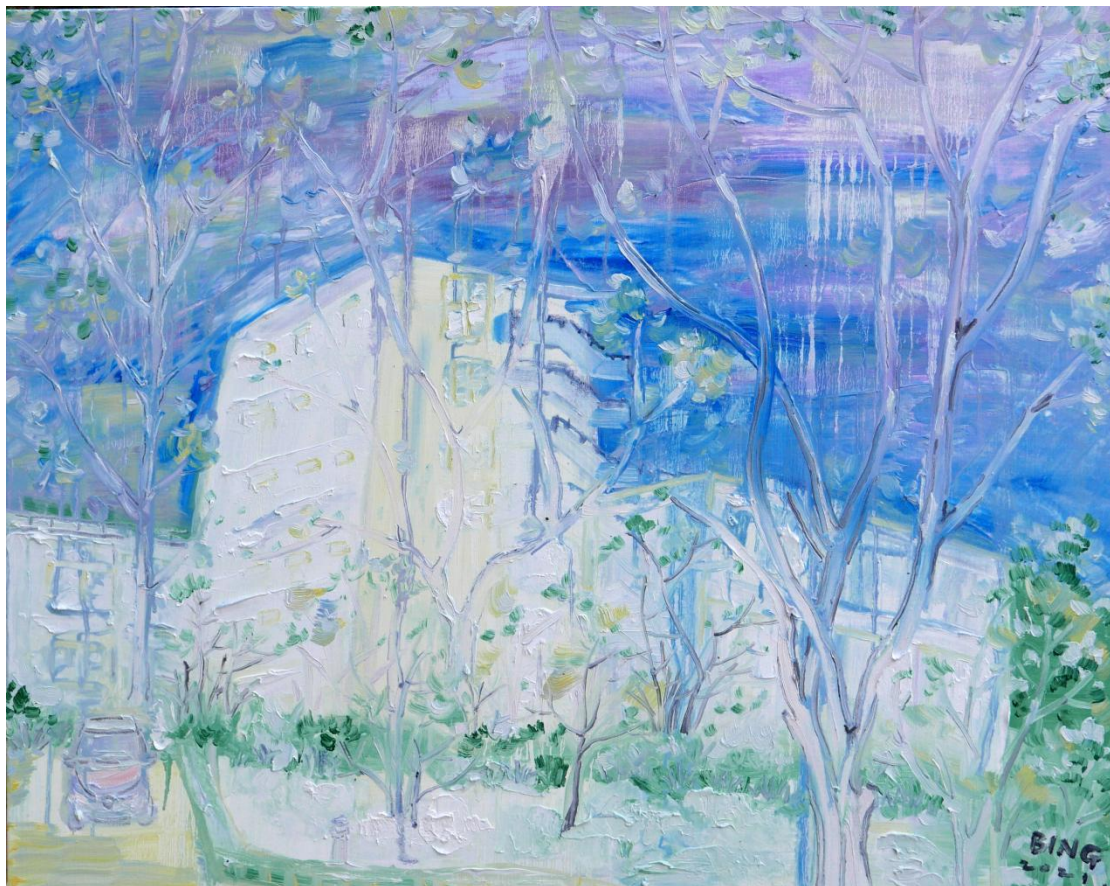
白风景系列之榆园 2 70×100cm 2021