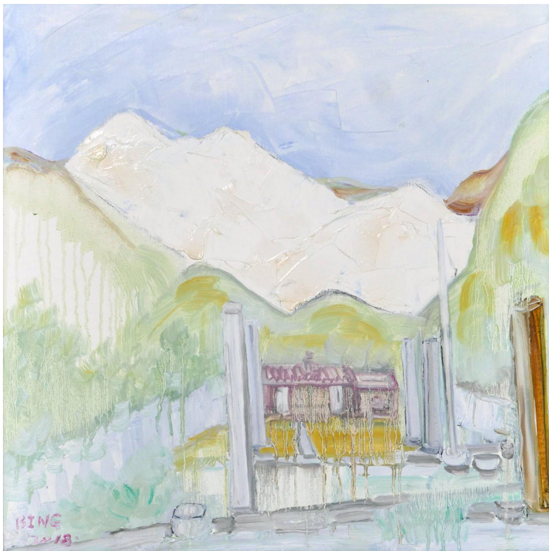
《白风景系列之大冶老屋》 60×50cm 2018