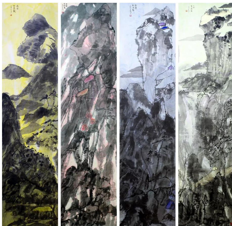
云中行山水之一 中国画 240×60cm