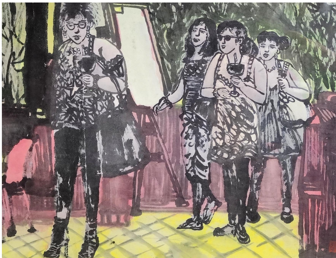
云中行水墨之 55 国画 40×30cm 2020