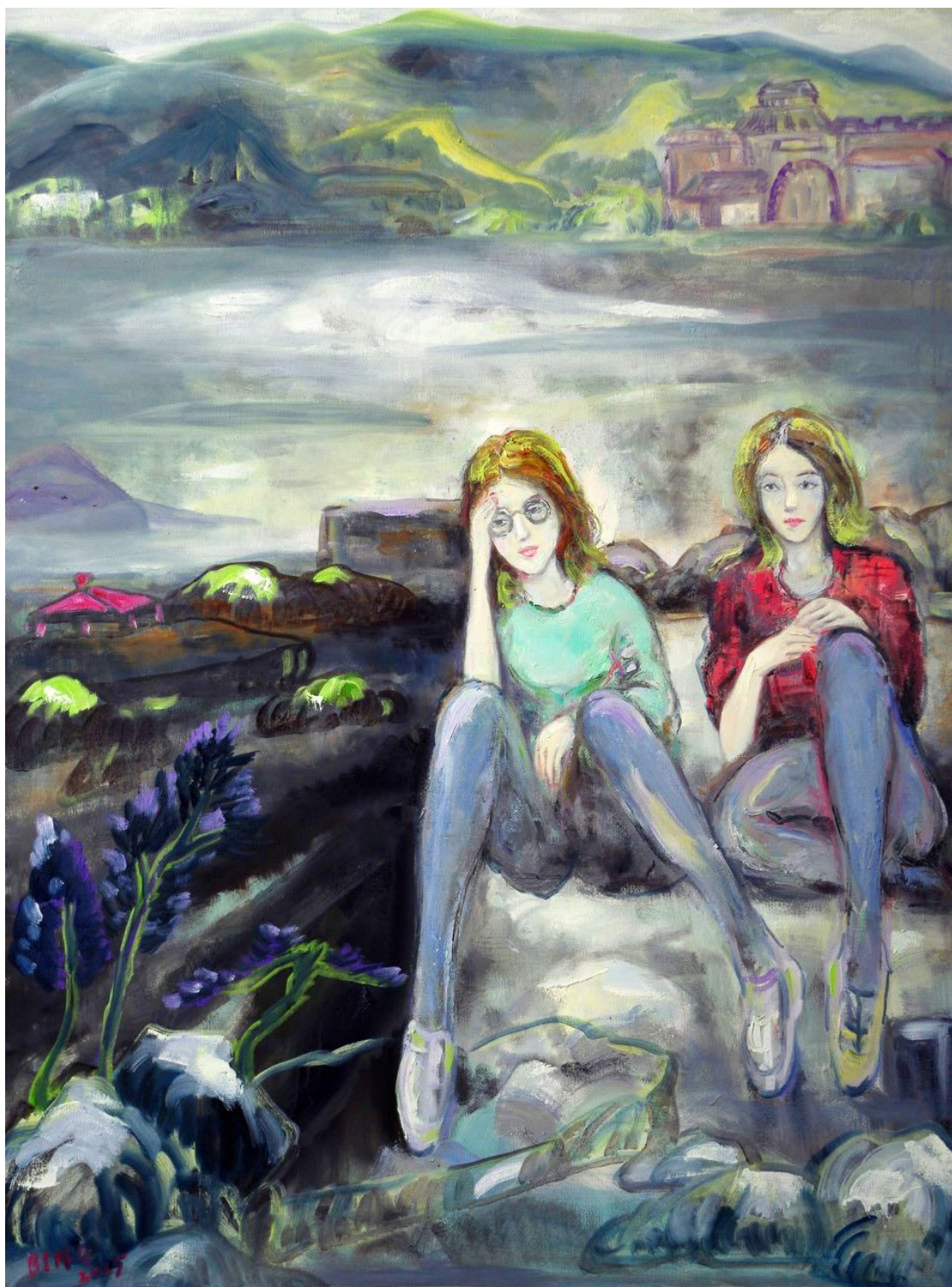
云中行系列之静夜思 布面油画 130X90cm 2015