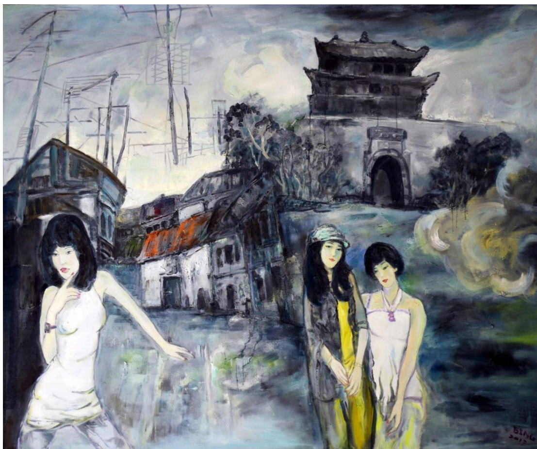
云中行系列之女郎 布面油画 180X150cm 2013