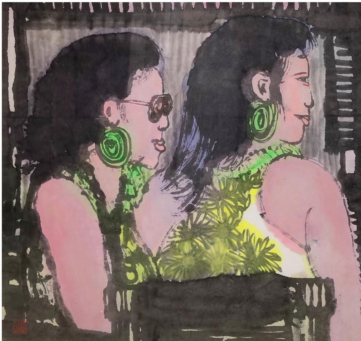
云中行水墨之 53 国画 40×30cm 2020